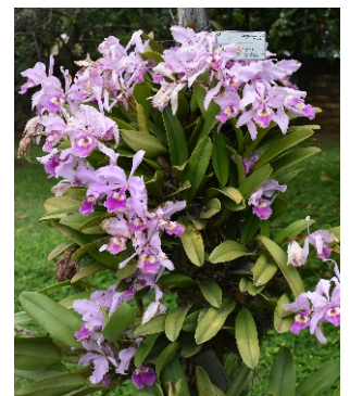
Fotografía tomada por: Alejandra López - Área de Diseño Clattleya Spp - Parque Kojima, Planta GEM

La conservación de la biodiversidad en Colombia resulta vital para las generaciones venideras, es por ello que, cumpliendo con nuestra visión ambiental 2021, incentivamos al personal de Mitsubishi Electric de Colombia en todas sus sedes a tomar fotografías de las especies vegetales, con el objetivo de concienciar en la importancia del cuidado en la flora.