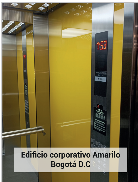
Edificio corporativo Amarilo Bogotá D.C

Al realizar un cambio de equipos con Mitsubishi Electric cuenta con mayor ahorro en el consumo de energía del ascensor y mínimo 20 años de vida útil con menores gastos asociados a fallos, reparaciones y repuestos.