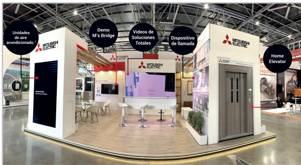
!Al respaldo de la pantalla vertical se exhibían tres unidades de aire acondicionado.

En el mes de agosto, durante los días 21, 22, 23 y 24 estuvimos presentes en Expocamacol, el evento más importante del sector de la construcción en la ciudad de Medellín, donde compartimos con nuestros clientes y visitantes brindando desde nuestro equipo comercial una asesoría especial de cada una de nuestras soluciones para edificios. Gracias a los que nos acompañaron e hicieron parte de este gran evento.